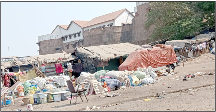
ચોકભજારના કિલ્લા પાછળ તાપી તટ પર ગેરકાયદે દબાણ અને ભારે ગંદકી આ તરવીરમાં નજરે પડે છે. સુરતના ઐતિહાસિક કિલ્લાનું ભવ્ય પુનઃનિર્માણ કરાયું છે ત્યારે ગેરકાયદે દબાણ અને ગંદકી ઐતિહાસિક કિલ્લાની શોભામાં બાધકરૂપ છે.